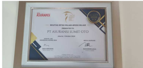
Insurance Awards 2024 Media Asuransi Ekuitas 150 milyar – 250 milyar