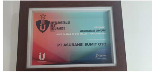
InvestorTrust Best Insurance 2024 Aset di Atas Rp 250 M – 500 M