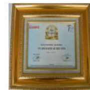
Media Asuransi Insurance Awards Best General Insurance 2021