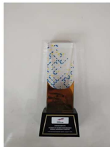
Best of Best Performance General Insurance Company 2025 InfoBank