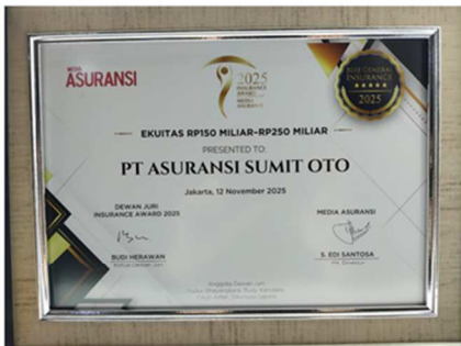
Best General Insurance 2025 by Media Asuransi Ekuitas 150 milyar – 250 milyar