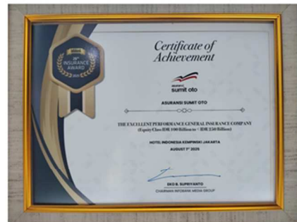
The Excellent Performance General Insurance Company 2025 Equity Class 100 – 250 billion (IDR)