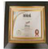
Infobank Insurance Awards Best Financial Performance 2018