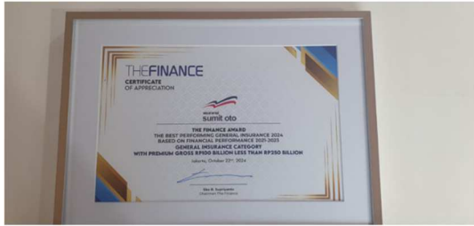
The Best Performing General Insurance 2024 With Premium Gross Rp 100 Billion Less than Rp 250 billion